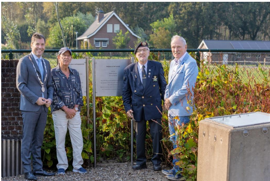
Plaquette ter herdenking van drie verzetsmensen bij het oorlogsmonument in Overasselt

De plaquettes ter herdenking van de drie verzetsmensen in Overasselt en de Amerikaanse slachtoffers bij de inname van de Sluisbrug in Heumen werden onder grote publieke belangstelling en stemmige muzikale bijdragen onthuld.