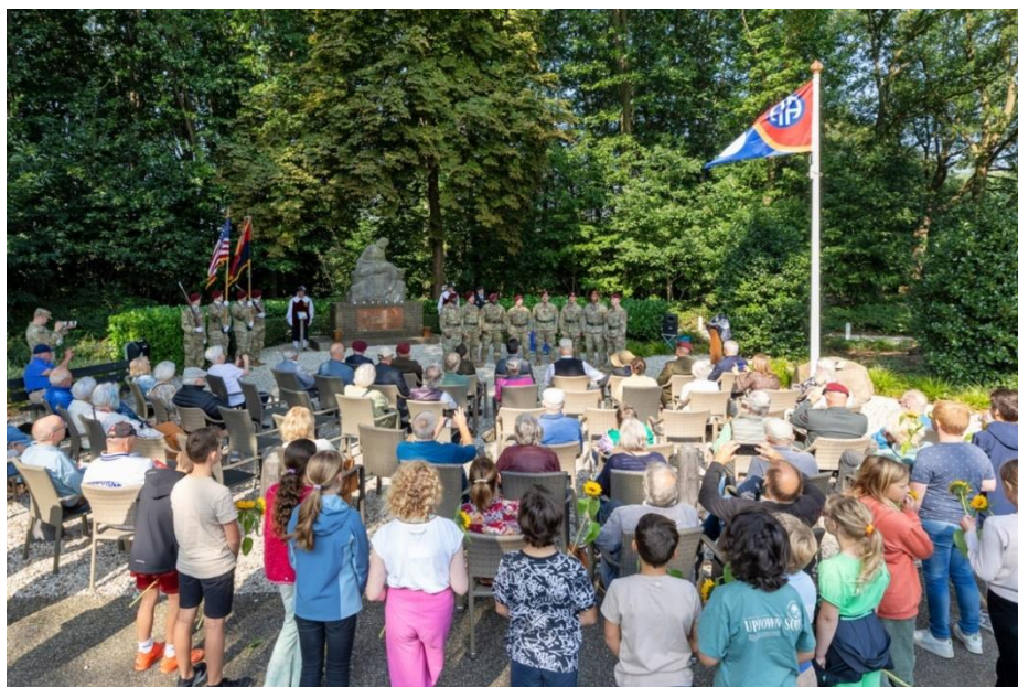
Onthulling plaque ter herdenking van de gesneuvelde Amerikaanse soldaten tijdens de inname van de Sluisbrug in Heumen, bij het oorlogsmonument in Heumen.